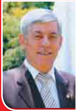
السواء موفق جمعة رئيس الاتحاد الرياضي العام

تجسيدا لمقولة السيد الرئيس بشار الأسد بقدر مانزوع من بذور صالحة نجني ثمارا ناضجة أقام الاتحاد الرياضي العام الاولمبياد الوطني الثاني للناشئين حيث جاء هذا الحدث الرياضي الهام تطبيقا لاستراتيجية المكتب التنفيذي للاتحاد الرياضي العام في توسيع قواعد الألعاب الرياضية واكتشاف المواهب الواعدة وتفعيل دور اتحادات الألعاب الرياضية وفروع الاتحاد الرياضي واللجان الفنية في المحافظات كما أتى بعد النجاح اللافت للنسخة الأولى حيث تكلفت جهود المؤسسات الرياضية كافة وتم اكتشاف العديد من المواهب الرياضية التي أصبحت اليوم ضمن عداد المنتخبات الوطنية . لقد باتت الأولمبياد ظاهرة رياضية سورية غير مسبوقه ترمي في دلالاتها إلى العديد من مظاهر التطوير والتجديد في المنظومة الرياضية فكرياً وعلى الصعيد العملي وهما بحد ذاتهما مؤشران إيجابيان على حيوية المنظمة وضبط تفاعلاتها بشكل إيجابي بما يعود على الرياضة السورية بالتقدم والازدهار ورفع العلم الوطني في المحافل الرياضية العربية والعالمية. أولمبياد الأمل .. واسع في أهدافه وافر في نتائجه المرتقبة وهو بداية عمل قادم لرعاية الموهوبين والواعدين الذين توجوا وتفوقوا وحققوا أرقاماً قياسية في ألعابهم ولابد من وضعهم تحت المجهر من قبل الاتحادات المعنية وصقل مواهبهم ورعايتهم كونهم الرافد الحقيقي لمنتخبات سبقتهم ولنجوم وصلوا للبطولات وكانوا مثلهم حتى نستطيع أن نحقق المزيد من الانجازات للرياضة السورية في ظل الرعاية الكريمة للسيد الرئيس بشار الأسد لمنظمة الاتحاد الرياضي العام وأبطالها .