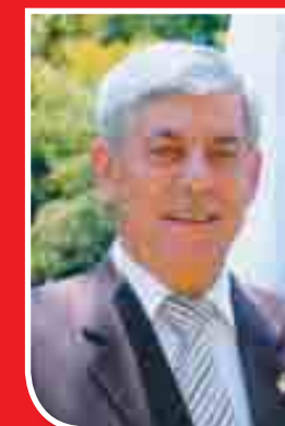
Chairman of the General Sports Federation

It is the beginning of future work to take care of talented and promising those who crowned, excelled and achieved record figures in their games and should be placed under the microscope by the concerned federations and hone their talents and take care of them because they are the real tributary of the teams before them and to Star achieve tournaments so that we can achieve greater achievements of Syrian sport under the patronage of Mr. President Bashar al-Assad to the Organization of the General Sports Federation and its heroes.