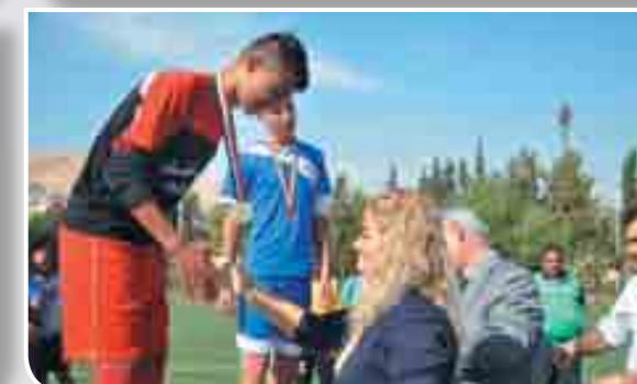
المركز الأول: الحسكة. المركز الثاني: اللاذقية. المركز الثالث: دمشق.